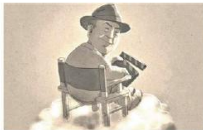
Bertolucci nel disegno di Marino Guarneri