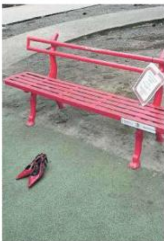
IL SIMBOLO La panchina rossa installata a Genova

È STATO RIMBORSATO ALLE REGIONI SOLO IL 25,9% DELLE RISORSE STANZIATE NELLO SCORSO TRIENNIO