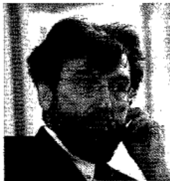
Storico Ernesto Galli della Loggia

tosì a destra e fece un'operazione coraggiosa sdoganando il Movimento sociale dalla pregiudiziale antifascista e alleandosi con la Lega. Ma questa soluzione non è stata poi capace di governare». In questo quadro il Mezzogiorno esce più sconfitto che mai: «Nel sistema politico italiano - ha affermato Galli della Loggia - il Sud non ha mai avuto iniziativa politica, il suo voto non ha mai sfondato il muro della maggioranza relativa se non con rare eccezioni. Il Mezzogiorno ha sempre avuto un ruolo di stabilizzazione ma non ha mai inventato culture politiche nuove». Le cause, secondo lo storico, sono da ricercarsi in «una società più lenta a capire e con meno stimoli, in un Sud troppo concentrato su se stesso». E Napoli in questo quadro non fa eccezione, anzi: «Quando venivo a Napoli nella mia gioventù notavo la presenza di uno stato borghese molto attivo e vivo. Oggi invece mi trovo di fronte a una classe popolare molto aggressiva, presente nel cuore stesso della città, con un suo peso e una sua cultura».