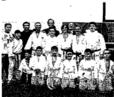
Il team I ragazzi del rione Sanità appassionati di arti marziali