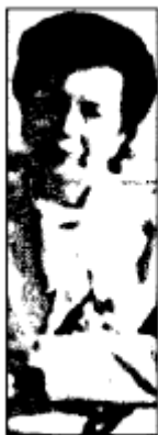
ROMA - La sindaca che fa? Fa

«Mamma, ma chi te lo fa fare di essere sindaco?». I cittadini esasperati "sottoscrivono"