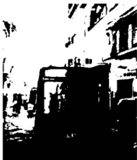
L'esordio del bus a Forcella