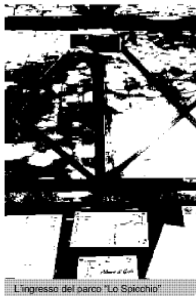
L'ingresso del parco "Lo Spicchio"

NAPOLI. Un raid notturno 45 giorni fa l'aveva devastato. Ora il Wwf, dopo aver fatto denuncia ai carabinieri per l'accaduto, scrive al sindaco, Rosa Russo Iervolino. Il "polmone verde" del Vomero, sorto dalle macerie dell'ex parco Case Puntellate, resta chiuso. A tal proposito la protesta nei confronti dell'amministrazione comunale che nonostante le tante sollecitazioni dell'associazione ambientale «è incapace di assicurare servizi essenziali alla cittadinanza». I responsabili del Wwf pretendono risposte dal Comune per la pessima situazione del "verde" in città e vogliono capire per quale motivo la "Napoli Servizi" non apre il parco e non svolge la regolare manutenzione. PRIMO PIANO A PAG.6