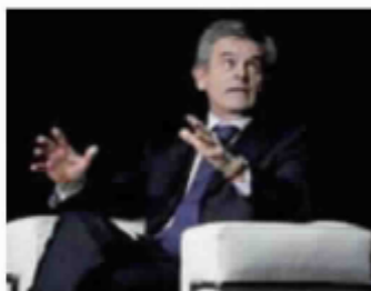
Anci Il presidente Sergio Chiamparino

Cosa dice il rapporto? Che la manovra inciderà nel 2011 più o meno omogeneamente su tutti i municipi, ma nel 2012 saranno maggiormente penalizzati quelli meridionali. Il patto di stabilità, riferendosi al 2009, è stato rispettato da quasi tutte le realtà e superato in Campania e Sicilia, oltre che in Lazio e Piemonte. In termini pro capite i Comuni più virtuosi sono quelli