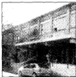
San Paolo: I dipendenti sono saliti sul tetto del nosocomio