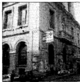
Loreto Crispi: In via Schipa rovesciati i bidoni dell'immondizia

NAPOLI (ciro crescentini) - Esplode la rivolta dei 1200 lavoratori dei servizi di pulizia degli ospedali cittadini di competenza dell'Asl Napoli 1. Tutti dipendenti di un'associazione temporanea di imprese (capogruppo la società Esperia). Non hanno ricevuto lo stipendio di giugno. Ieri sono proseguite le azioni di lotta. Occupate le direzioni sanitarie degli ospedali Ascalesi, Annunziata, Loreto Crispi, San Paolo. Le proteste si svolgono all'interno e all'esterno dei nosocomi. Promossi blocchi stradali in città e sulla tangenziale. In via Michelangelo Schipa, sono stati rovesciati cassonetti dell'immondizia. I dipendenti delle pulizie dell'ospedale San Paolo di Fuorigrotta, sono saliti sul