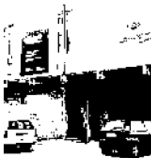
Il centro Gridas di Scampia. Lo Iacp ha intimato lo sfratto alla struttura

re al Carnevale di quartiere del Gridas, che ogni anno denuncia i problemi della città. Il destino dell'associazione è ora nelle mani di Palazzo San Giacomo. L'Iacp propone infatti una permuta immobiliare per sbloccare la situazione: non chiede soldi per trasferire il possesso delle strutture realizzate a Scampia, ma la proprietà di altri siti. «Puntiamo al rilancio della zona — conclude infatti Acampora — attraverso la costruzione di attività commerciali e residenze». Attualmente il Gridas non è il solo a occupare la palazzina, si sono insediate infatti anche altre piccole organizzazioni. E spesso la criminalità usa alcuni locali per i suoi commerci: i blitz delle forze dell'ordine sono frequenti. La Procura di Napoli ha avviato indagini preliminari nel 2005 e rinviato a giudizio l'associazione e gli altri occupanti per invasione di edificio pubblico. Il Gridas, a differenza di altri incriminati, ha rifiutato il patteggiamento della pena, e a dicembre affronterà il processo proprio per regolarizzare la propria presenza nello stabile.