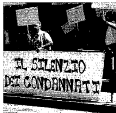
Lo striscione: «Subiamo in silenzio» la protesta a San Pietro a Paterno

Lettera al prefetto Pansa «Venga a vedere in che condizioni vivono i rom e quanti disagi ci creano»