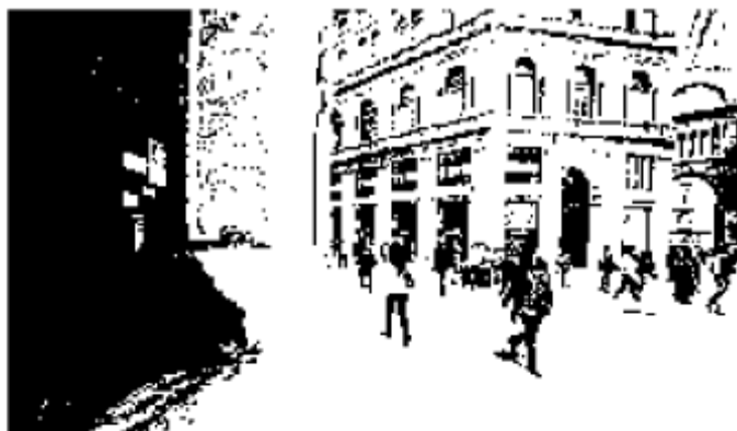
Il recente rogo alla Galleria Umberto

Il Fai: adottiamo il monumento e proviamo a rivalutarlo