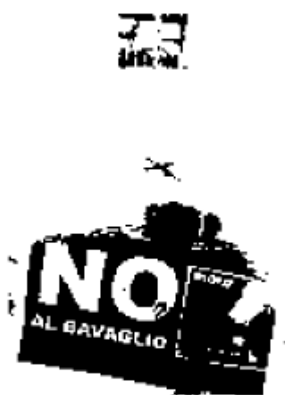
Una recente manifestazione di protesta del popolo Viola