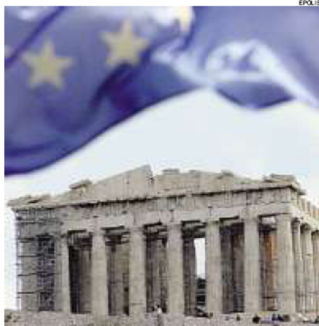
► Il Partenone e la bandiera dell'Europa

Il crac greco ha fatto da detonatore, bisogna fare cassa in fretta, tagliare la spesa e aumentare le entrate