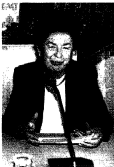
Il sindaco Rosa Russo Iervolino: il suo mandato scade tra un anno