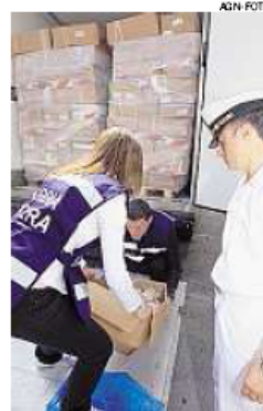
► Sequestro polpi congelati

ne dell'ingresso del container e la successiva ispezione del carico. «Dietro le prime file di scatole - spiega Picone - il cui contenuto è risultato a norma, sono stati rinvenuti scatoloni al cui interno erano custoditi polpi congelati il cui peso era inferiore ai 450 grammi e, dunque, polpi di cui è vietata la commercializzazione, ma di eccellente qualità». A vietare la messa in commercio di polpi di simili dimensioni, una normativa emanata dal Consiglio dell'Unione europea volta a salvaguardare la specie in aree sensibili per la riproduzione come la zona a ovest dell'Africa e, dunque, le