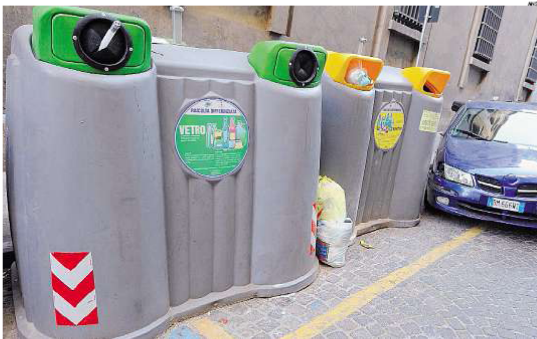
► Campane per la raccolta differenziata dei rifiuti a Napoli

IERI È ARRIVATA l'amara sfoglia della Avcp, l'Autorità di vigilanza sui contratti pubblici di lavori, servizi e forniture. L'Authority ha tirato le somme di una indagine «di vigilanza» avviata il 17 giugno scorso sulle modalità di gestione dei servizi integrati dei rifiuti affidata a società capitale interamente pubblico, come quella di Napoli, l'Asia. Coinvolte, 28 città italiane: a 19 Amministrazioni comunali è stato chiesto di adeguarsi alla normativa europea ed italiana. Sulla totalità dei casi analizzati, 7 sono risultati conformi, 12 comuni dovranno adottare appositi rimedi mediante modifiche delle clausole statutarie delle società controllate, mentre i rimanenti 9 comuni sono stati giudicati non conformi alla normativa. A Napoli, manco a dirlo, è tutto da rifare: fa parte di quei casi in cui la scelta di affidare i servizi ad una municipalizzata non conviene alle tasche dei cittadini, bensì a quelle dei privati che gestiscono una o più fasi della raccolta della spazzatura. In soldoni: dall'indagine è emerso che la filiera della gestione dei rifiuti, «risulta frammentata e affidata spesso a vari gestori nelle sue diverse fasi, raccolta, spazzamento, trasporto». Cosa suc-