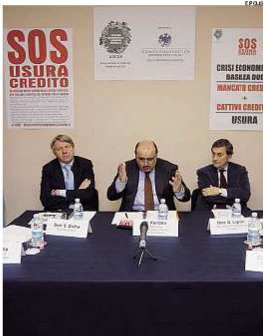
La presentazione dello sportello Sos usura-credito

LA FAMIGLIA di commercianti napoletani ha denunciato l'accaduto nei giorni scorsi, raccontando la propria storia in una e-mail che ora si è trasformata in una vera e propria denuncia alle forze dell'ordine. Dopo undici giorni di attività,