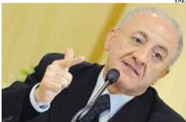
► Vincenzo De Luca (Pd)

I « GIÀ VISTO, GIÀ SENTITO » si sprecano: basta leggere i progetti per il recupero dell'ex Italsider o quelli per l'Ambito 13 di San Giovanni a Teduccio o guardare le foto delle stazioni del metrò. De Luca parla di «ag-