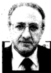
Vincenzo De Luca

Candidato del Pd alla presidenza della Regione Campania, sostenuto da Pd, Api, Verdi, Partito socialista, Campania libera, Italia dei Valori, Sinistra Ecologia e Libertà, Radicali