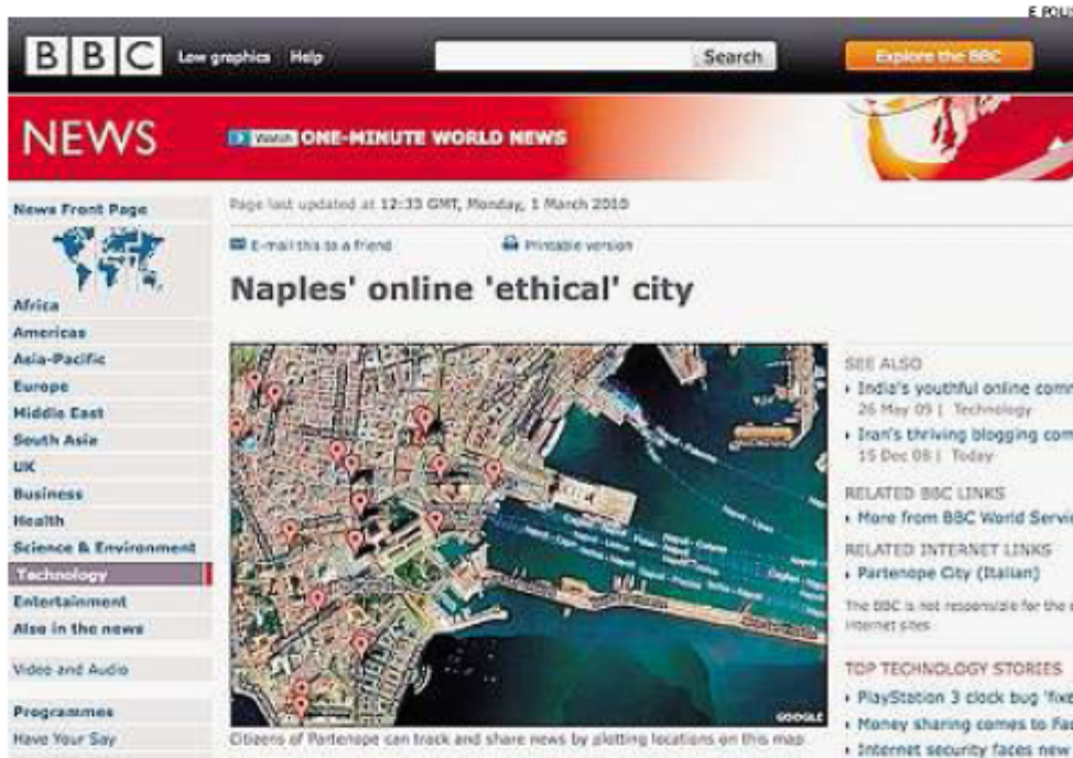
► Il servizio della Bbc sulla Città di Partenope