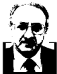
Vincenzo De Luca

Candidato del Pd alla presidenza della Regione Campania, sostenuto da Pd, Api, Verdi, Partito socialista, Campania libera, Italia dei Valori, Sinistra Ecologia e Libertà, Radicali