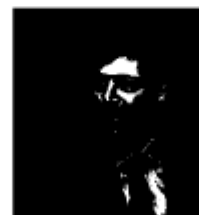
Il sindaco di Portici Enzo Cuomo

riconosciuta dalla prefettura. Tutte le associazioni seguono le vittime, le consigliano. E poi ci sono anche degli aiuti economici previsti dalla legge 44/99. Chi denuncia non è solo. Siamo una famiglia, e la forza di una famiglia è l'unità. Solo restando uniti saremo invincibili”. Poi un appello ai politici tutti: “Mi rivolgo a tutti i politici: il tema della camorra deve essere una tematica prioritaria, non deve essere un argomento centrale nel periodo della campagna elettorale. La politica deve investire seriamente, con interventi nelle scuole, con corsi di legalità nelle scuole. La priorità deve essere quella di dare un futuro migliore ai nostri figli e liberarli dalla paura”.