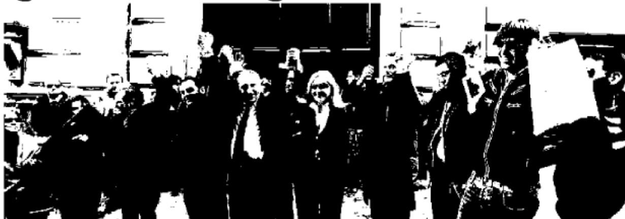
Il girotondo dei gestori dei musei privati attorno al Madre