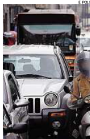
► Un autobus nel traffico

chero e sarà aggiunto al gasolio tradizionale. Per la Seconda università di Napoli, il "petrolio verde" ridurrà del 60% le emissioni di anidride carbonica e farà disperdere nell'ambiente meno ossido di azoto. La Regione, che ha finanziato l'iniziativa stanziando 30 mila euro, e l'Eav si sono impegnati a far viaggiare a biocombustibile un bus su dieci (circa 52 vetture) entro due anni. ■ALE.MIG.