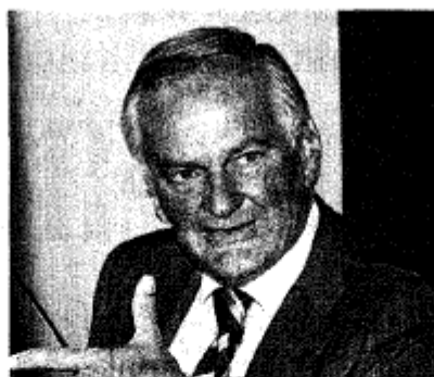
L'assessore Cascetta è responsabile dei trasporti alla Regione