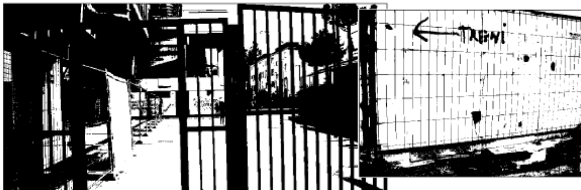
Nella foto l'ingresso della metropolitana in via Piedimonte d'Alife

I residenti lamentano rapine, sosta selvaggia e inquinamento acustico. Pronta una petizione