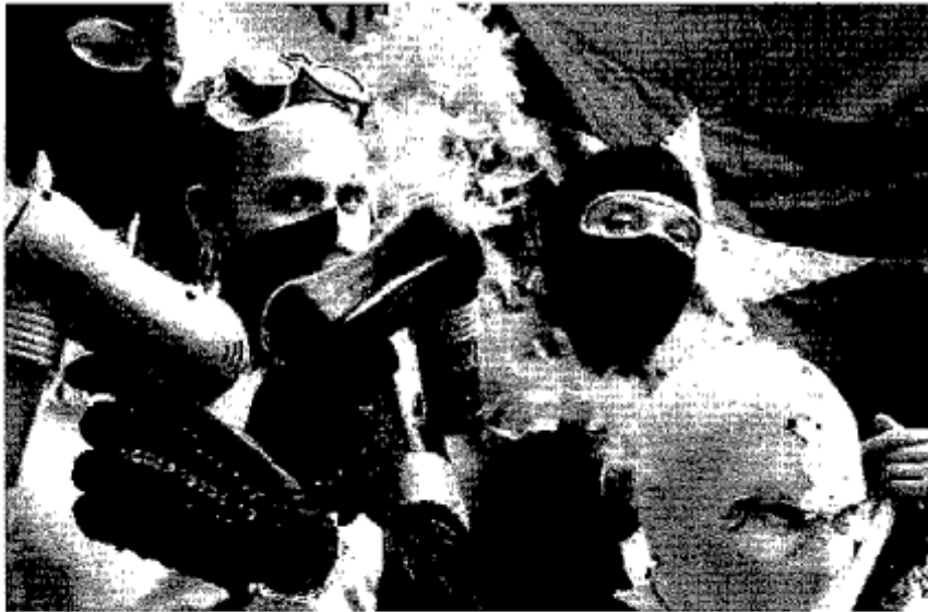
In piazza Dai Quartieri a piazza Dante: la sfilata dei quattro cortei